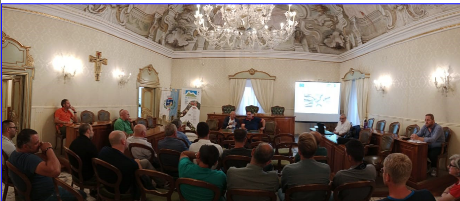
Forum partenariale, presso il Centro Stella di Gangi (14/09/2023)