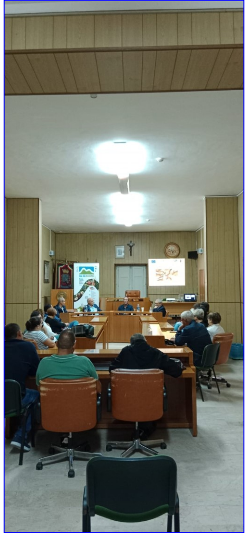
Forum partenariale presso il Centro Stella di Alia (09/10/2023)