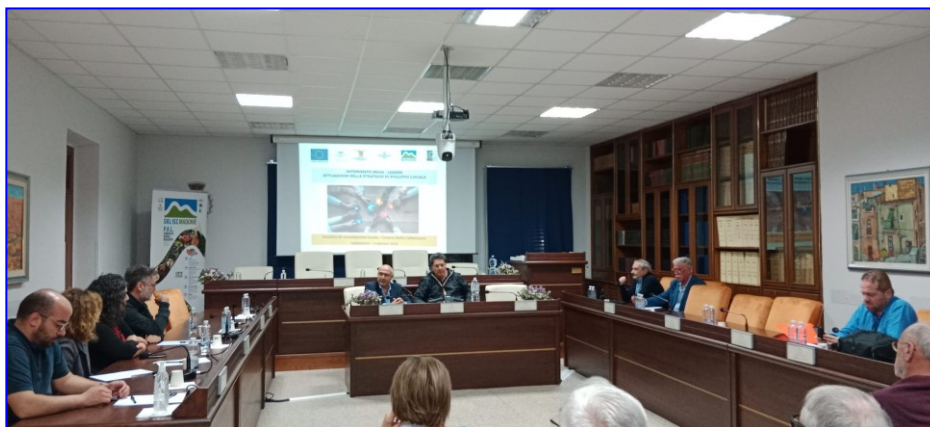
Forum partenariale presso il Comune di Valledolmo (05/10/2023) – Centro Stella di Caltavuturo