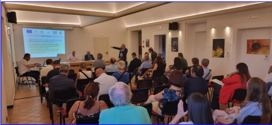
Forum partenariale presso il Centro Stella di Castelbuono (08/08/2023 alla presenza del Dirigente U.O. S3.02 – LEADER)