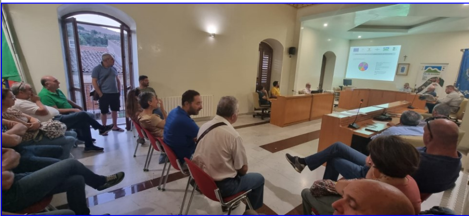
Forum partenariale presso il Centro Stella di Bompietro (11/09/2023)