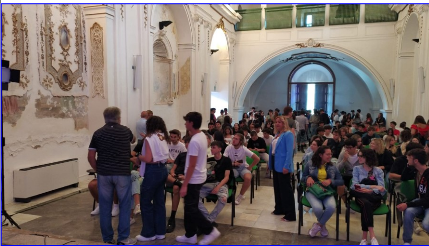
UTC Communities' Sustainable eXperience